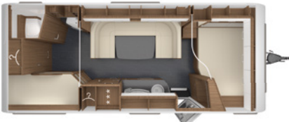
ROSSINI 620 DM 2,5