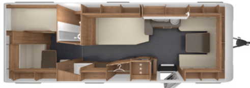
DA VINCI 700 KD 2,5