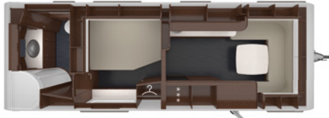
PUCCINI 750 HTD 2,5