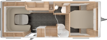
VIVALDI 685 DF 2,5